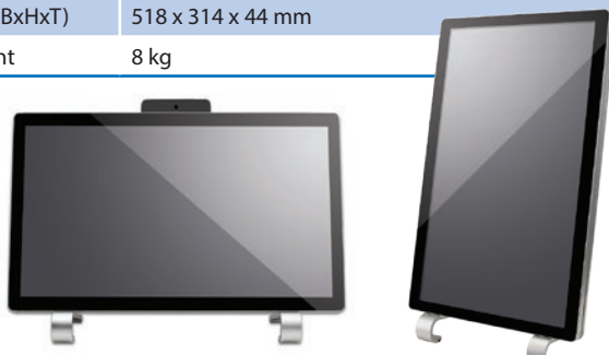
Horizontale oder vertikale Montage bzw. Aufstellung (Zubehör optional).