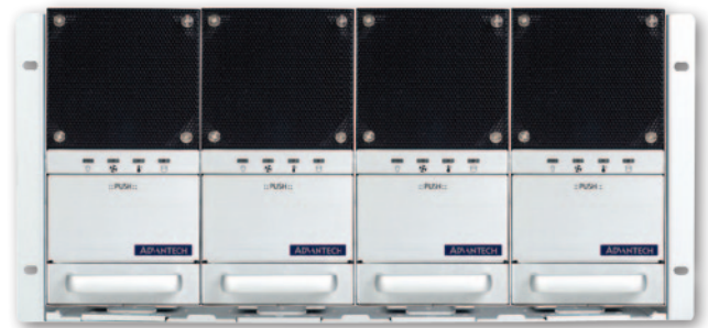
4x VIS-IPC-6025 kombiniert als 19" Rackmount IPC (5 HE)